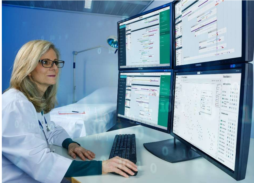
Bild (1): Das visuell-interaktive Tool zur Kohortenanalyse unterstützt forschende Ärztinnen und Ärzte, indem es eine präzisere Einteilung der Patientinnen und Patientinnen in Gruppen ermöglicht.

Fraunhofer- Gemeinschaftsstand Halle 2.2, Stand D- 108